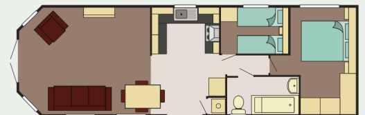
40 x 13 2 Bed