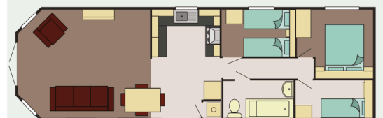
41 x 13 3 Bed